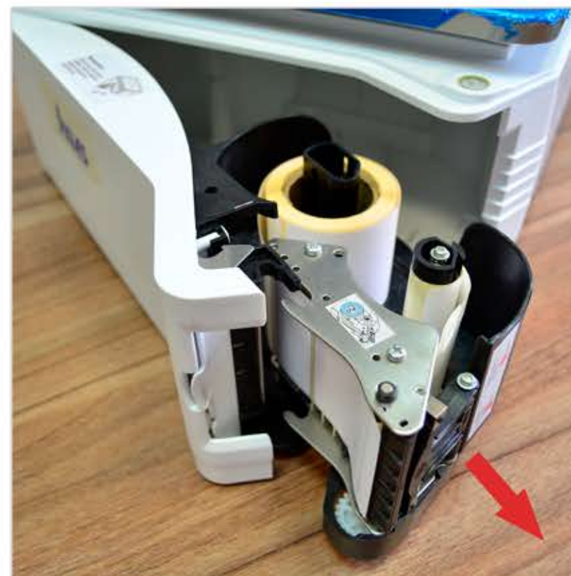
3. Вытащите кассету