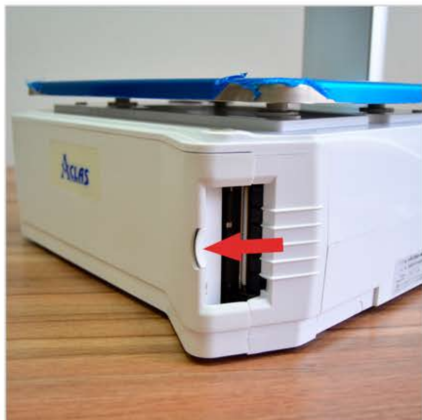
1. Нажмите на кнопку