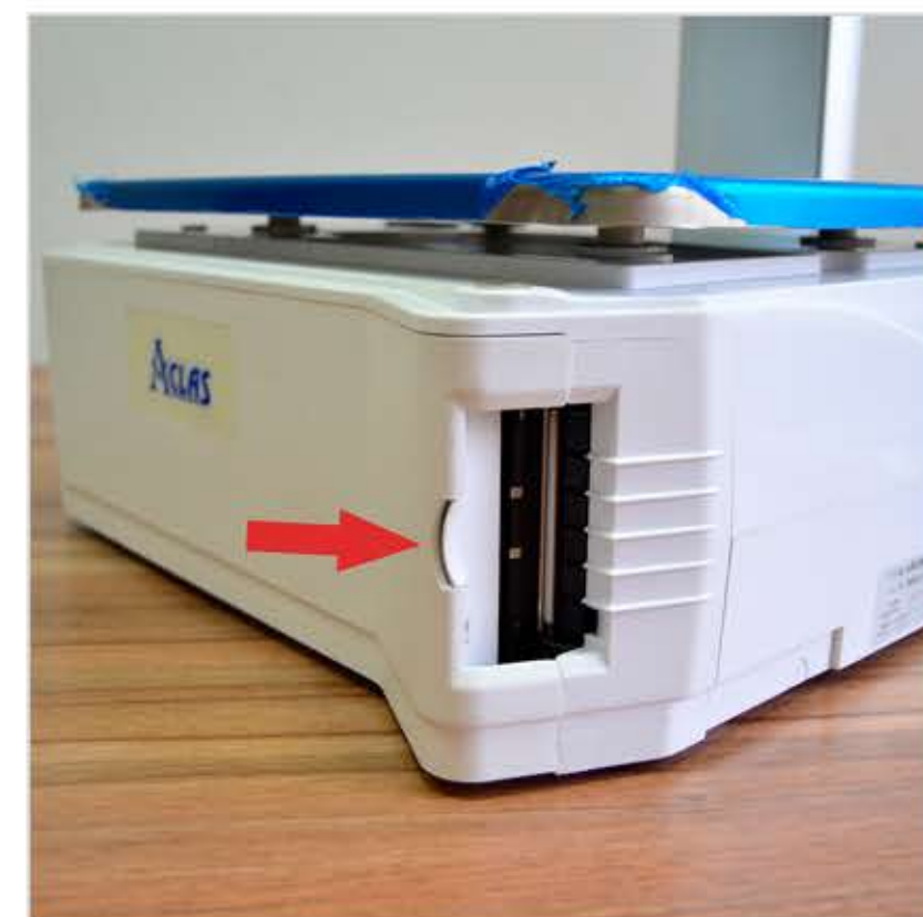
8. Закройте крышку принтера до щелчка