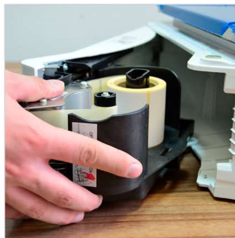
7. Вставьте кассету в пазы и вдвиньте до упора