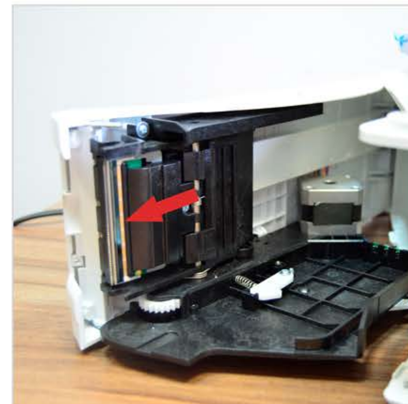
4. Осмотрите головку