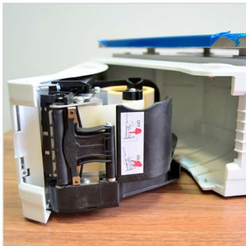
2. Откройте до упора